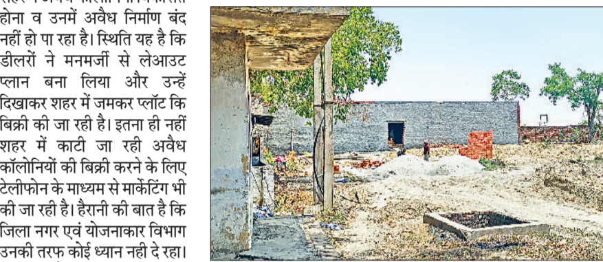
गन्नौर। बेगा रोड पर अवैध कालोनी में हो रहा अवैध निर्माण व कालोनी में बनाई गई सड़क।

हरिभूमि न्यूज ▶▶ गन्नौर लोगों को सस्ते रेट और किरतों में प्लॉट खरीदने के लिए कहा जा रहा