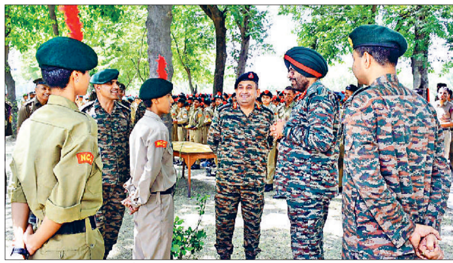
सोनीपत। कैडेट्स के साथ जानकारी साझा करते हुए मेजर जनरल एवं अन्य।