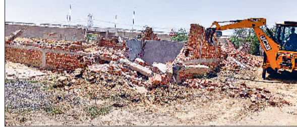
खरखौदा। अवैध निर्माण को धराशायी करते हुए डीपीटी दस्ता

गुरुवार को गांव फतेहपुर में 4 एकड़ जमीन पर विकसित की जा रही अवैध कालोनी का ध्वस्त किया गया। कार्रवाई के दौरान 3 डीपीसी, 8 बाउंड्री वाल, 2 निर्माणधीन रिहायशी घर तथा 4 निर्माणधीन व्यवसायिक दुकानों को ध्वस्त किया गया। जिला नगर योजनाकार अधिकारी (डीटीपी) नरेश कुमार के अनुसार जिला में विकसित हो रही अवैध कालोनियों तथा अवैध निर्माण को शुरूआत में ही ध्वस्त करने के लिए उपायुक्त डॉ० मनोज कुमार के निर्देशन में प्रशासन द्वारा