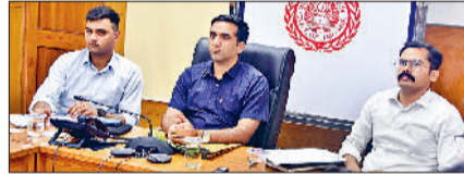
स्टैंडिंग न लगाया जाए ताकि बरसात के सीजन में गेहूँ खरब न हो। उन्होंने समाधान शिविर में आने वाली शिकायतों की समीक्षा करते हुए कहा कि शिविर में आने वाली शिकायतों का संबंधित अधिकारी प्रथमिकता के साथ निवारण करवाएं।

सोनीपत। मण्डलायुक्त संजीव वर्मा ने गुरुवार को बाढ़ नियंत्रण कार्यों को लेकर वीसी के माध्यम से उपखुस्तों के साथ समीक्षा बैठक की। इस दौरान उन्होंने अधिकारियों को निर्देश दिए कि बाढ़ नियंत्रण को लेकर जिला में चल रहे कार्यों को तेजी से पूरा करवाएं ताकि बरसात सीजन के दौरान लोगों को किसी प्रकार की परेशानी न आए। उन्होंने कहा कि शहर व गांवों में बरसाती पानी की निकासी के लिए उचित व्यवस्था बनवाई, ताकि कहीं भी बरसात का पानी इकट्ठा न हो। मण्डलायुक्त ने मण्डियों में गेहूँ के उठान को लेकर अधिकारियों को निर्देश दिए कि किसी भी मण्डी में गेहूँ का