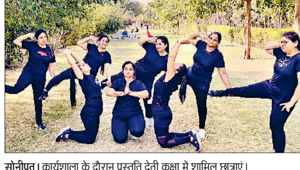
सोनीपत। कार्यशाला के दौरान प्रस्तुति देती कक्षा में शामिल छात्राएं।