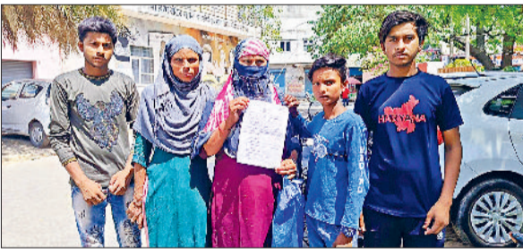
सोनीपत। शिकायत दिखाते हुए महिलाएं।

पुलिस ने अपहरण का मुकदमा दर्ज कर की जांच शुरू हरिभूमि न्यूज ▶▶ सोनीपत सेक्टर-27 शहर थाना क्षेत्र घर से जन्मदिन का केक लेने के लिए निकली दो नाबालिग सहेलियों के लापता होने के आरोप का मामला सामने आया है। लड़कियों की मां की शिकायत पर पुलिस ने अपहरण का मुकदमा दर्ज कर लिया है। पुलिस मामले की जांच कर रही है।