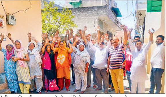
सोनीपत। बिजली समस्या को लेकर विरोध प्रदर्शन करते हुए लोग।

वैस्ट रामनगर के निवासी पिछले 15 दिनों से बिजली समस्या से जूझ रहे हैं। समस्या से परेशान लोगों ने वीरवार को बिजली निगम के खिलाफ प्रदर्शन किया। लोगों ने बताया कि कई बार शिकायतें करने के बावजूद समस्या का समाधान नहीं हो रहा। समस्या की मुख्य वजह ट्रांसफार्मर में गड़बड़ी बताई गई है। कई दिनों से लगातार ट्रांसफार्मर का प्यूज उड़ जाता है, जिसके कारण वोल्टेज की समस्या हो रही है। शिकायतकेंद्र से लेकर अधिकारियों तक शिकायत करने के बावजूद समस्या का समाधान नहीं हो रहा। प्रदर्शनकारी लोगों ने बताया कि रात को प्यूज उड़ जाता है, जिसके कारण वोल्टेज कम-ज्यादा हो जाती