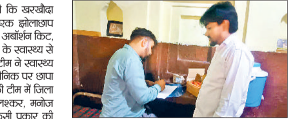
मिला। इस दृष्टि से क्लीनिक संचालक द्वारा किसी भी तरह का उल्लंघन नहीं किया गया है। इसलिए क्लीनिक पर उनके विभाग की कोई भी आगामी कार्यवाही नहीं बनती है।