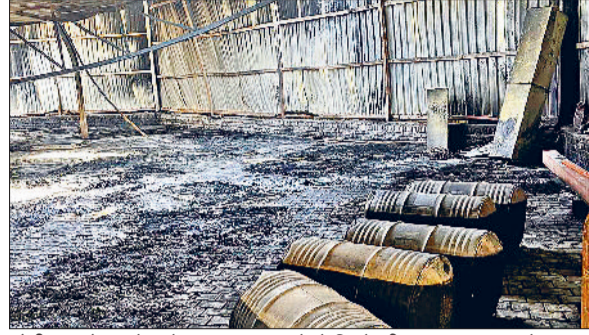
सोनीपत। गोदाम में जले डम व आग लगने से गिरने की कगार पर पहुंचा शोड।