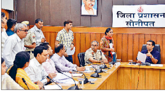
सोनीपत। अधिकारियों के साथ समाधान शिविर में जनसुनवाई करते डीसी।

हरियाणा सरकार के निर्देशों के अनुसार रोजाना समाधान शिविर का आयोजन किया जा रहा है। जिला स्तरीय समाधान शिविर उपायुक्त की अगुवाई में लघु सचिवालय में तो खंड स्तरीय समाधान शिविर संबंधित एसडीएम की अगुवाई में आयोजित किया जा रहा है। लेकिन समाधान शिविर में शिकायतें तो आती हैं, लेकिन उनका समाधान कम ही हो रहा है। जिले में गुरुवार को कुल 107 शिकायतें समाधान शिविर में रखी गई थीं, जिसमें से केवल 19 शिकायतों का ही समाधान हो पाया, जबकि 88 शिकायतें लंबित हैं। इन 107 शिकायतों में से सबसे अधिक 99 शिकायतें सोनीपत स्थित लघु सचिवालय में उपायुक्त के निर्देशन में आयोजित समाधान शिविर में सामने आईं। वहीं 6 शिकायतें खरखौदा एसडीएम, 2 शिकायतें