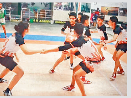
गन्नाौर। सीएमआर अकेडमी में मेट पर कबड्डी खेलती लड़कियां।